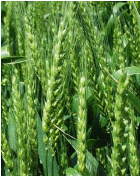
Trigo Antes de Madurar